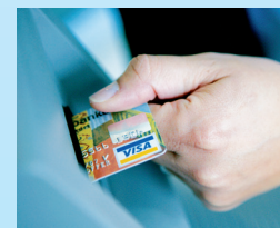
Wählen Sie zwischen verschiedenen Kartenlesern (optional)